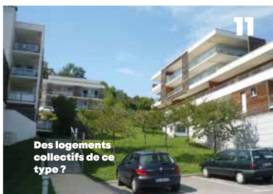
Des logements collectifs de ce type ?