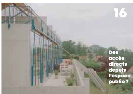
Des accès directs depuis l'espace public ?