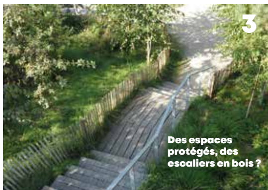
Des espaces protégés, des escaliers en bois ?