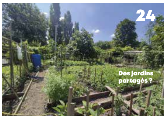
Des jardins partagés ?