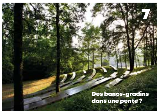
Des bancs-gradins dans une pente ?