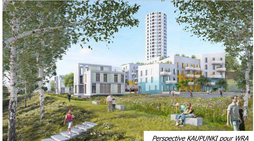
Perspective KAUPUNKI pour WRA

Espace de vente : 9, place Abbé Pierre www.vivrelacolline.com