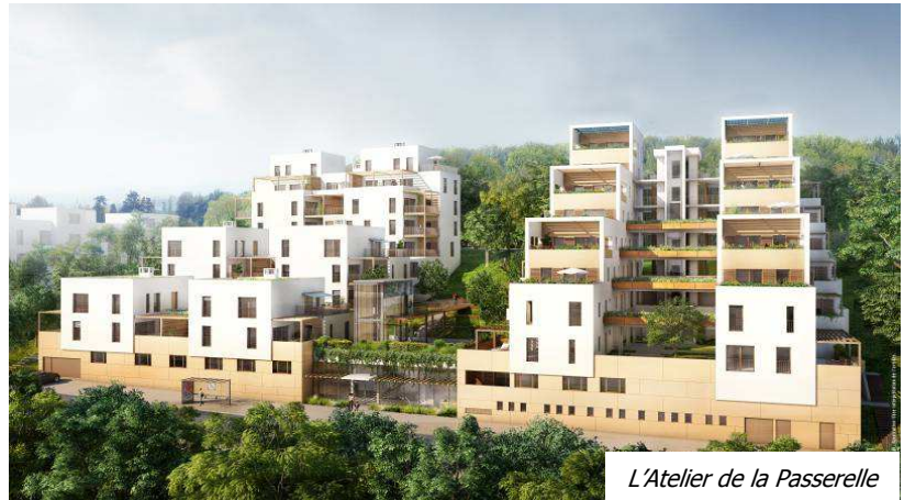
L'Atelier de la Passerelle

Parti Architectural : Ce projet propose une architecture collinaire support d'une qualité de vie. Il est sobre et trouve son animation par le rythme des terrasses en gradin. On perçoit bien l'échelle d'une opération globale de 81 logements organisés, de part et d'autres d'une « trouée » paysagère, en deux sous-ensembles résidentiels (îlot 7 et 8). La perception d'une combinaison de logements organisés autour d'une terrasse en véritable pièce de vie supplémentaire confère à l'ensemble la lecture d'une échelle domestique d'habitat intermédiaire.