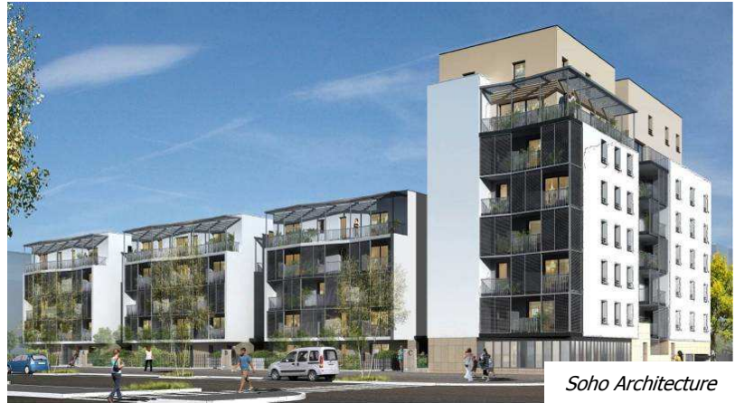
Soho Architecture PERSPECTIVE D'INSERTION ANGLE SUD-EST

Rhône Saône Habitat propose un programme de 60 logements en accession sociale sécurisée. Ce programme permet aux acquéreurs de bénéficier des mesures en faveur de l'accession sociale sécurisée à la propriété grâce à une acquisition aidée, une acquisition abordable et une acquisition sécurisée.