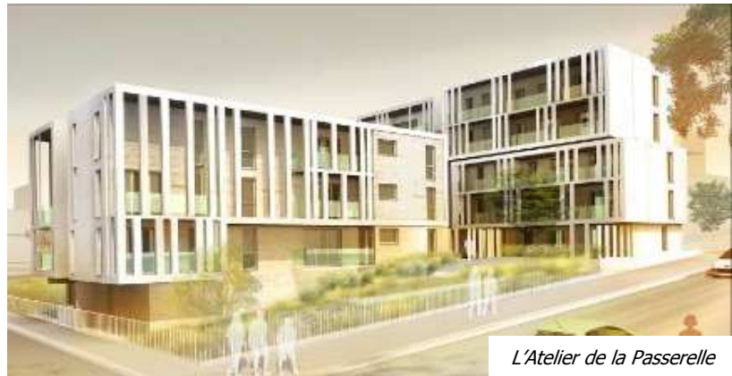
L'Atelier de la Passerelle

L'îlot 21 bénéficie d'un emplacement privilégié, en bordure du parc du Vallon. L'opération est constituée de plusieurs types d'habitat social, de part et d'autre de la voie longeant le parc. D'un côté, un petit collectif de 4 logements qui se présente comme une grande maison individuelle, de l'autre deux unités distinctes : 10 logements dans un bâtiment de 2 étages et 15 logements dans un bâtiment de 4 étages. L'ensemble épouse la pente naturelle du terrain.