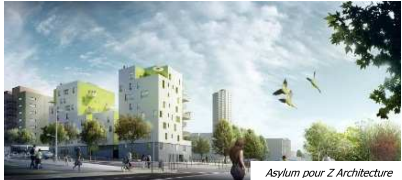
Asylum pour Z Architecture

Situé à la lisière du quartier de la Duchère et des pentes du parc du Vallon, l'îlot 20 marque l'entrée ouest du quartier et s'impose en véritable belvédère sur les monts du Lyonnais.