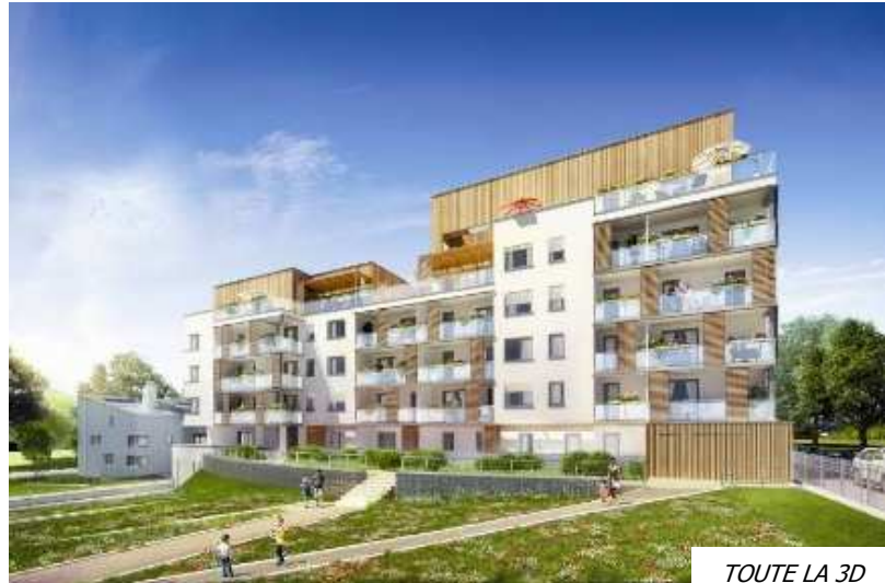
TOUTE LA 3D

Contact : 04 72 34 33 34 www.slsi-promotion.com