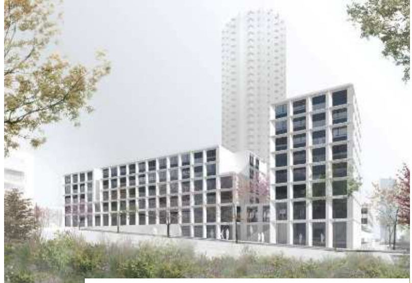
Croquis depuis rue du Versant – VERA & ASSOCIES Architectes

Résidences Sociales de France développe un projet de résidence pour les jeunes, étudiants et salariés, au cœur du quartier renouvelé de La Duchère.