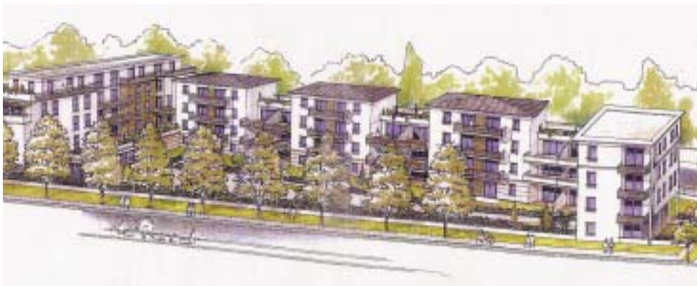
PROJET EIFFAGE PERSPECTIVE DEPUIS L'AVENUE BEN GOURION

TOUS LES LOGEMENTS SOCIAUX DÉMOLIS SUR LE QUARTIER SERONT RECONSTITUÉS. DE NOUVELLES OFFRES DE LOGEMENTS SERONT PROPOSÉES. CERTAINS PROJETS SONT DÉJÀ TRÈS AVANCÉS. APERÇU.