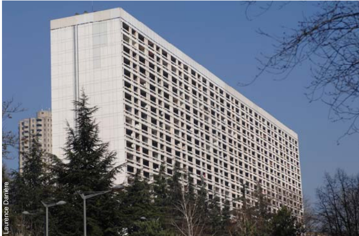
La barre des Erables, construite par l'architecte Jean Dubuisson en 1972

A l'origine, les Erables étaient constitués d'appartements en location. Mais en 1975, une partie d'entre eux a été mise en vente, scindant cet ensemble en deux entités : l'une en copropriété, les Erables Nord, l'autre les Erables Sud (allées 256 à 259 bis rue des Erables) en location appartenant à la SIAL, filiale du groupe Alliade. Il s'agissait de 170 logements locatifs non sociaux.