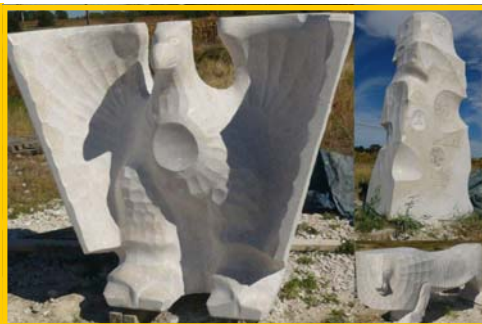
3 des 4 sculptures qui seront installées dans le square Averroès