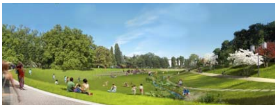
Parc du Vallon