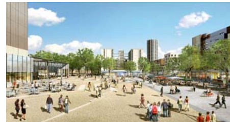
Place Abbé Pierre