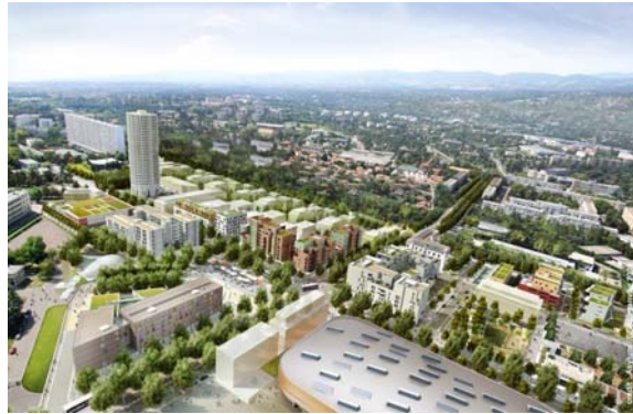
La Duchère 2015