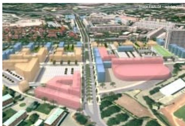
Projet urbain Première phase > 2008