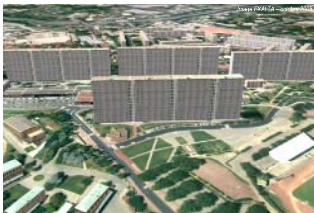
La Duchère > 2003

A l'échelle de la Ville de Lyon, le projet vise aussi à rééquilibrer la part du logement social sur l'ensemble de son territoire. Ainsi, les 680 logements démolis à la Duchère en 2005 seront tous reconstruits sur Lyon, prioritairement dans les autres arrondissements (hors 8 ème ).