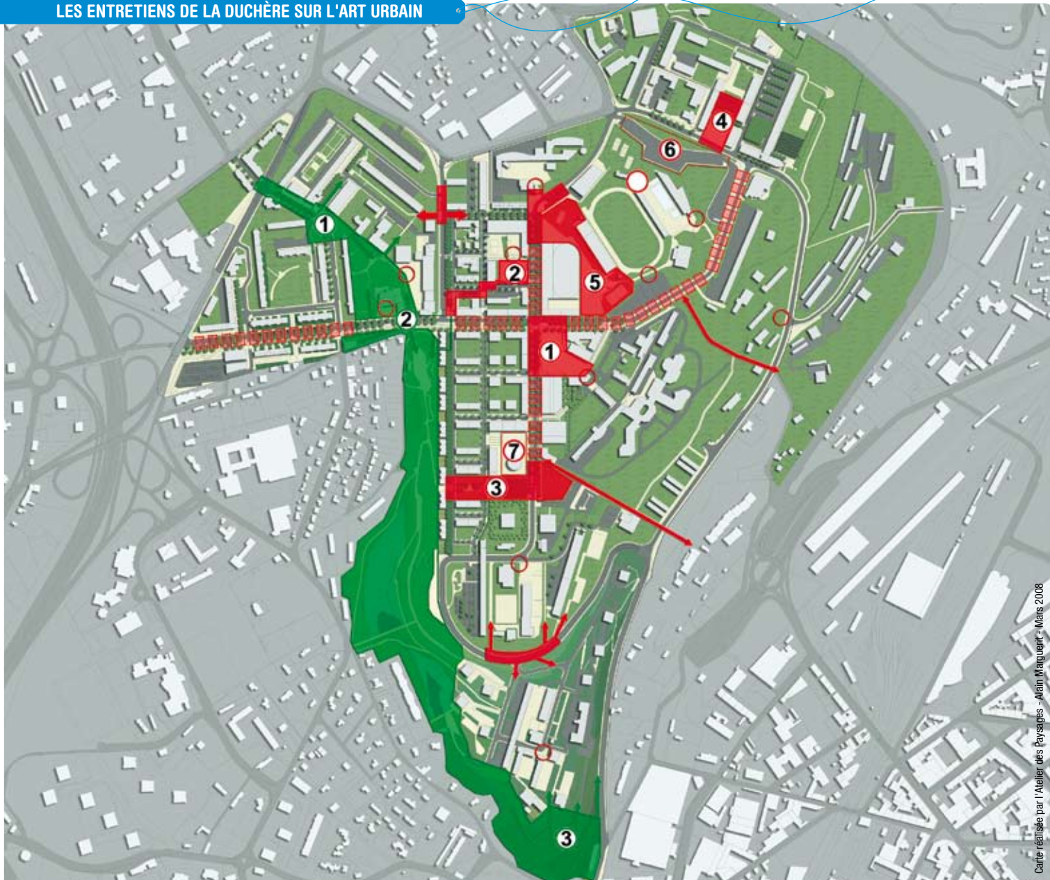
Carte réalisée par l'Atelier des Paysages - Alain Marguerit - Mars 2008